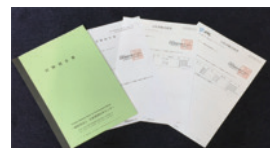
北里環境科学センター 日本食品分析センター試験報告書

※注意1 (*PM2.5に含まれる重金属類や花粉の殻を不活性化することはできません)